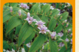
ホトギス 9月下旬~10月上旬