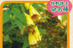
ジョウロウホトギス 9月下旬~10月中旬