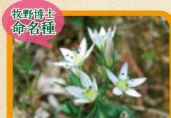
センブリ 10月下旬~11月