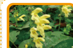
キバナアキギリ 9~10月