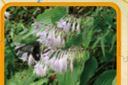
スダレギボウシ 8月下旬~9月