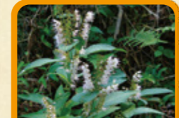
シモバシラ 9月下旬~10月