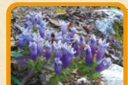
アサマリンドウ 10~11月