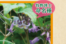
オオクサボタン 9~10月