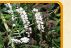
サラシナショウマ 10月