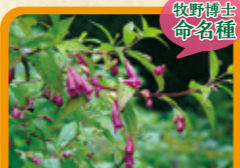
タニジャコウソウ 9月