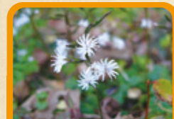
キッコウハグマ 10月下旬~12月