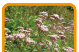
サワフジバカマ 10~11月上旬