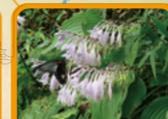
スダレギボウシ 8月下旬~9月