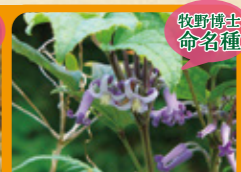
オオクサボタン 9~10月