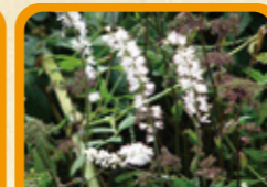
サラシナショウマ 10月