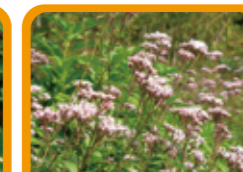
サワフジバカマ 10~11月上旬