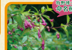
タニジャコウソウ 9月