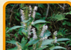
シモバシラ 9月下旬~10月