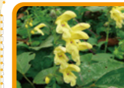
キバナアキギリ 9~10月