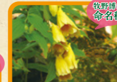
ジョウロウホトギス 9月下旬~10月中旬