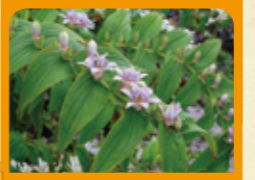
ホトギス 9月下旬~10月上旬