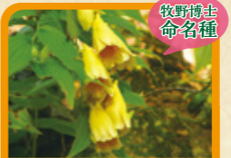
ジョウロウホトギス 9月下旬~10月中旬