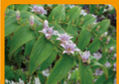
ホトギス 9月下旬~10月上旬