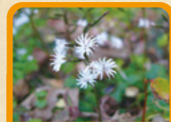
キッコウハグマ 10月下旬~12月