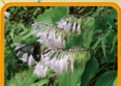
スダレギボウシ 8月下旬~9月