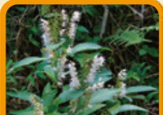
シモバシラ 9月下旬~10月