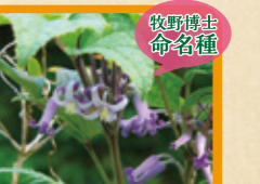
オオクサボタン 9~10月