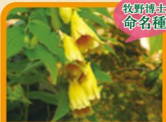
ジョウロウホトギス 9月下旬~10月中旬