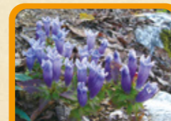
アサマリンドウ 10~11月