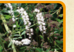
サラシナショウマ 10月