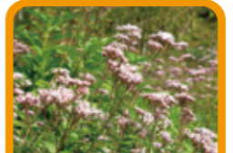
サワフジバカマ 10~11月上旬