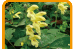
キバナアキギリ 9~10月