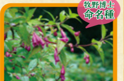
タニジャコウソウ 9月